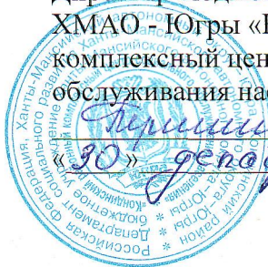
График заседаний Попечительского совета 2020 год.