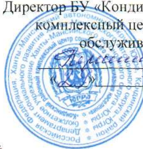
График заседаний Попечительского совета 2019 год.